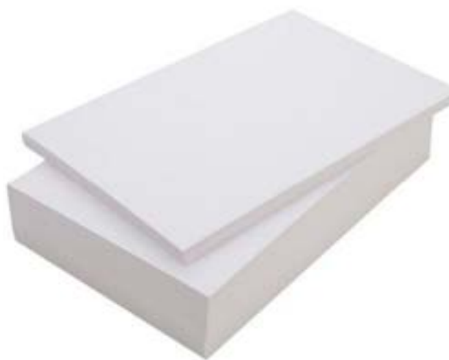
Papel Couché Fosco