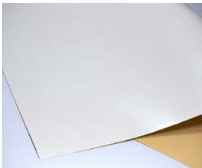
Papel Cartão Duplex