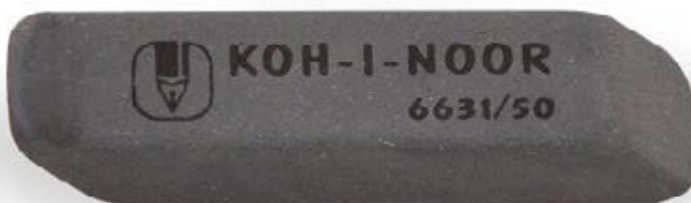
Borracha para nanquim (Cinza)

Os papéis apropriados para ao uso da borracha são os papéis acetinados brilhantes tais como o papel couché (Brilhante), papel cartão duplex e o papel cartão triplex.