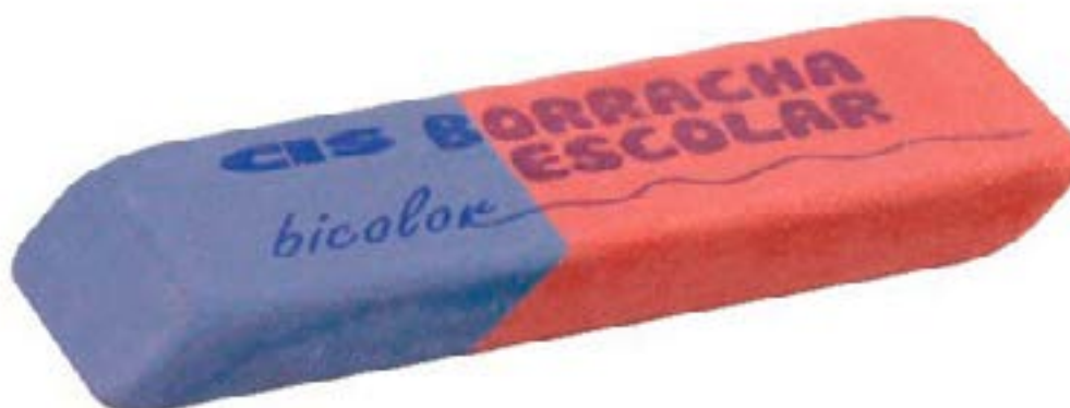
Borracha para nanquim (escolar bicolor)