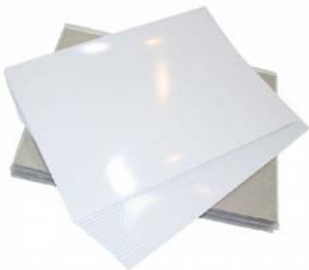
Papel Couché Brilhante

Ótimo papel fazer efeitos com traços e pontos que podem ser apagados com uma borracha apropriada, isso sendo possível apenas no papel canson couché acetinado e brilhante, estas atribuições servem também para o papel cartão duplex ou papel cartão triplex.