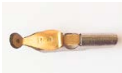
Pena Ponta Redonda