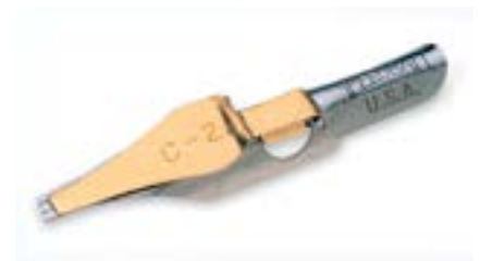
Pena Ponta Quadrada